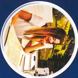
TECHNIK ORGANIZACJI TURYSTYKI