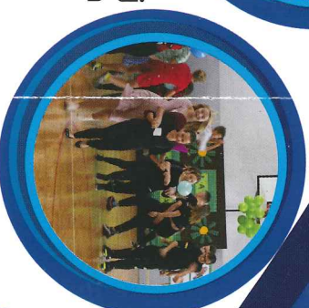
Turniej Integracyjny klas I