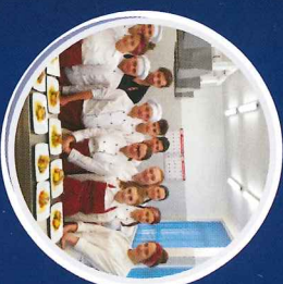
Zajęcia dodatkowe m.in. warsztaty gastronomiczne