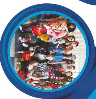
100 dni do matury