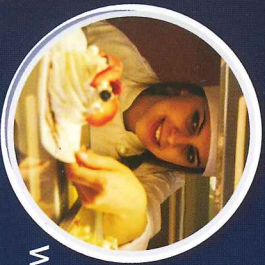
KUCHARZ, CUKIERNIK ORAZ W INNYCH SPECJALIZACJACH W SZKOLE BRANŻOWEJ I STOPNIA