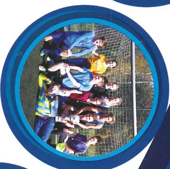
Turniej Piłki Nożnej o Puchar Dyrektora ZSGH